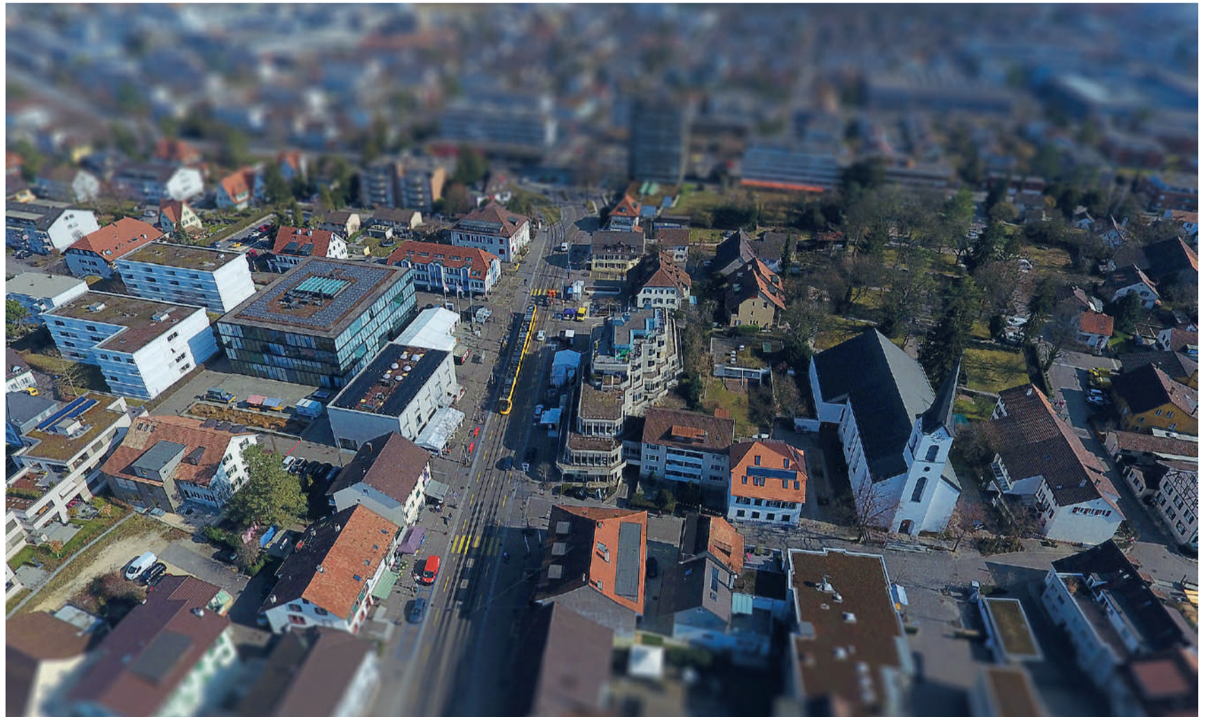
Ob die BDP ihren Sitz im Wahlkreis Reinach halten kann, ist ungewiss. Es ist der einzige der Kleinpartei im Landrat.